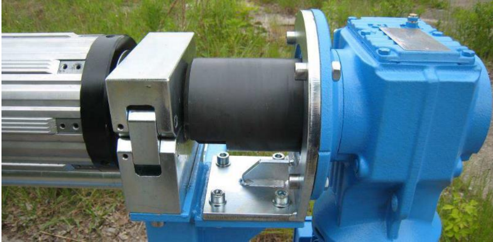
ICE-Trade Kupplung & Messinglagerung