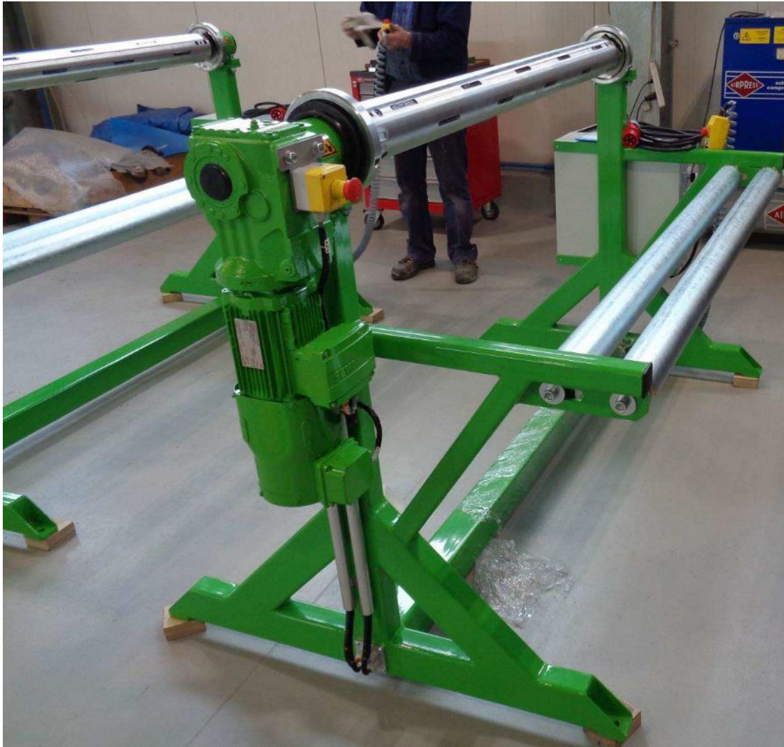
ICE-Trade Streifen-Wickelmaschine mit ICE-Trade Klapplager

Neben dem Wickeln mehrere Streifen kann die Wickelmaschine auch Gummi- und PU- Folien oder PVC-Gurte wickeln. Die 2 einstellbaren Einlaufrollen lenken die Streifen oder Gurte so, dass sie auf einer Linie gewickelt werden.